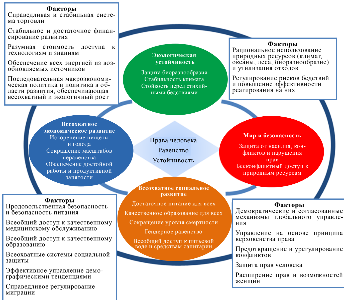
Схема II Целостная схема строительства «будущего, которого мы хотим для всех» в соответствии с повесткой дня в области развития Организации Объединенных Наций на период после 2015 года

40. На схеме II показана целостная модель достижения целей в области устойчивого развития на пороге тысячелетия, основанная на модели развития Никарагуа.